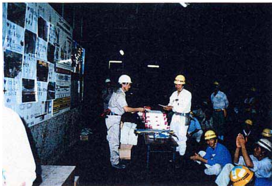
良い事例は表彰され、賞品が授与される