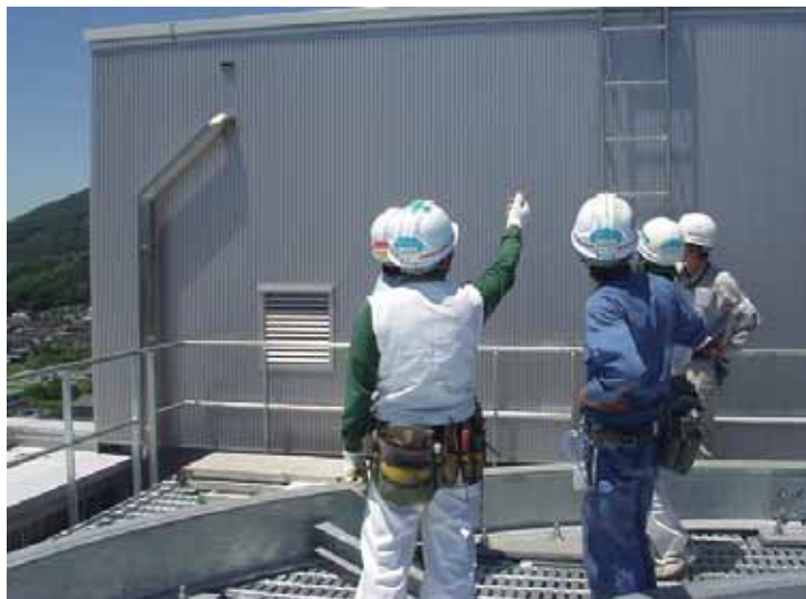
写真3 「一声かけ隊」現場パトロール