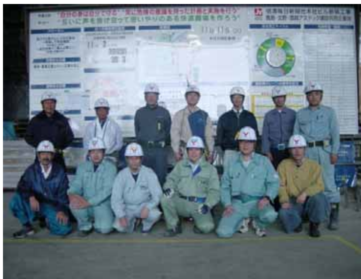
写真4 「一声かけたい」のメンバー