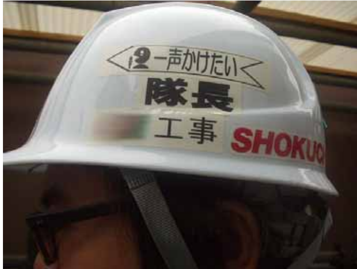
写真2 「一声かけたい」のステッカー